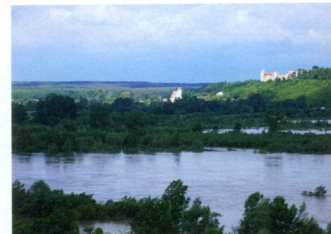
Panorama Janowca widziana z nad kamieniołomu w Kazimierzu Dolnym

Gazeta Janowiecka spełnia funkcje lokalnego informatora. Ze względu na większą regularność oraz aktualność podejmowanej tematyki jest chętnie czytana przez grono członków i sympatyków TPJ oraz innych mieszkańców janowieckiej gminy.