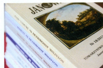
Notatnik Janowiecki biuletyn TPJ