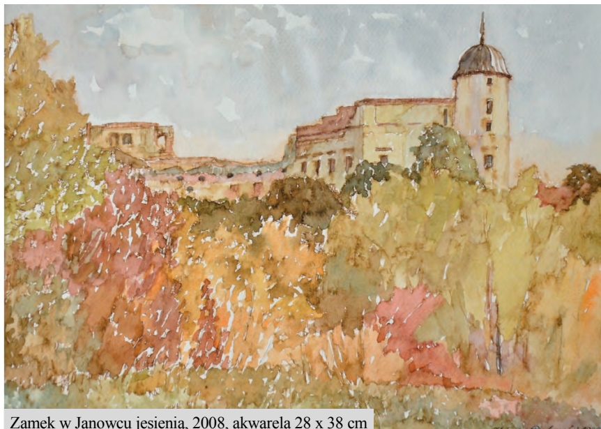
Zamek w Janowcu jesienią, 2008, akwarela 28 x 38 cm

W swoim dorobku posiada szereg indywidualnych i zbiorowych wystaw, brał udział w plenerach i konkursach. Był członkiem grupy plastycznej „Rezonans” i „Absolwent”. Wyróżniony i odznaczony przez Ministra Kultury