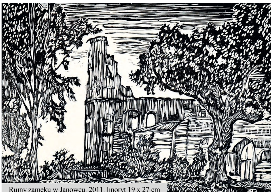
Ruiny zamku w Janowcu, 2011, linoryt 19 x 27 cm

i Sztuki za działalność w dziedzinie plastyki. W 2010 roku otrzymał Nagrodę Prezydenta Miasta Puławy za całokształt działalności w dziedzinie twórczości artystycznej. Wieloletni gospodarz pracowni edukacji plastycznej w Puławskim Ośrodku Kultury „Dom Chemika”. Jest członkiem Puławskiego Stowarzyszenia Nauczycieli Plastyków. Uprawia grafikę warsztatową, rysunek, plakat oraz malarstwo akwarelowe.